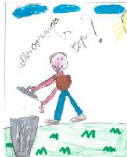
Alles opruimen is top! Stan (2B)